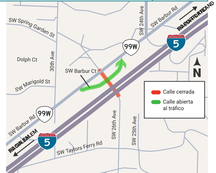
SW 26th Avenue estará completamente cerrada para los vehículos motorizados entre debajo de I-5 y debajo Barbur Boulevard por aproximadamente un año. SW Barbur Court seguirá abierta para el tráfico.

Estamos limitando el trabajo nocturno a 90 noches, para que el ruido del proyecto sea menos molesto para el vecindario aledaño. Durante estas noches, los vecinos podrían escuchar ruido de la construcción. Usaremos medidas de mitigación de sonido para reducir el ruido. Use la línea telefónica de ruido nocturno, disponible las 24/7 para hablar de cualquier preocupación relacionada con el sonido: 503-276-7892.