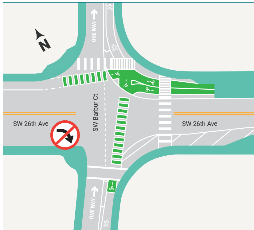
Mejoras en la intersección de SW 26th Avenue y SW Barbur Court.

Visite el sitio web del proyecto para obtener más información. bit.ly/swi-5repair