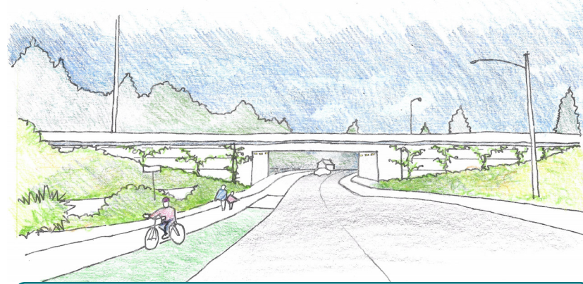
Un bosquejo de las mejoras en SW 26th y la nueva estructura vistas desde SW 26th Avenue hacia el sureste.